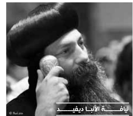
نياقمة الأنبا ديفيد

+ الكنيسة تُعطي القاباً كثيرة للرب يسوع المسيح ، فمنها أنه الإله الحق والرب و القدوس والمخلص والفادي والسيد والمعلم وابن الإنسان وابن الله والكلمه والحمل وخبز الحياه ونور العالم والراعي الصالح وملك الملوك ورب الأرباب والألف واليائه . . . الخ . ولكل لقب معناه ومدلولاته الكتابيه واللاهوتيّه ، لكن الأهم من هذا كله هو : ما هي علاقتي الشخصيه بكلٍ من هذه الألقاب ؟