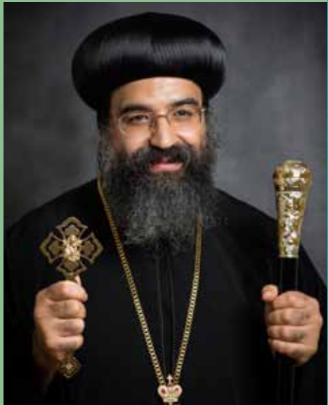
نيافة الأنبا كاراس